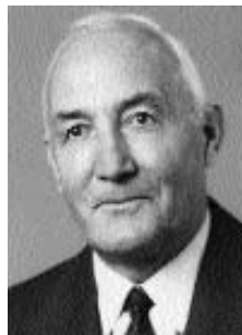
Adolf Sax-Geissmann 7. 7. †

Juli 3.-8. Sperrung Strasse Axenstein-Tavanasa wegen Belagsarbeiten. - 5. Fischerv.: Wettfischen. - 6. SSV beschliesst Durchführung der Schw. Alpinen Skimeisterschaften in Obersaxen. - 7. In Ilanz stirbt Adolf Sax-Geissmann (1912-97), der 24 Jahre Gemeindepräsident von Obersaxen war und 10 Jahre den Kreis Ruis im Grossen Rat vertrat. - 8. Ende einer extremen dreiwöchigen Regenperiode. - 11. Jugend Brass Band GR: Konzert im MZG. - 12.-19. Chorwoche im MZG, Leitung Paul Steiner. - 13. Kindergartenv.: Kinderfest im Pifal. / Beginn Sommerbetrieb Bergbahnen. - 14.-16. Erneut Sperrung Strasse Axenstein-Tavanasa. - 18. Schiessv.: Beginn 9. Billard-Turnier im Rest. Agarta. / Chorwoche: Abschlusskonzert im MZG. - 19. VVO: GV, neuer Präsident Sigisbert Caduff-Gwerder. / "Wisali" Sommer-Nr. mit einem Resümee der sportlichen Leistungen des Skiteams erscheint. - 20. Turnv. Flond und Obersaxen: Bergstafette Stein-Piz Mundaun. - 21. Gde-Verband Surselva: Informationen zur Einführung des Sackgebührensystms ab 1.9.97. - 25. Spielgruppe: Kinder der Jg. 93-94 können ab Sept. 97 diese besuchen. / Bundesamt für Landwirtschaft: Tafelzweitschgenaktion 6 kg Fr. 11.50. - 26. Schulrat: Bekanntgabe Fahrplan für Bus und Postauto 97/98. / Brass Werk Shop: Abschlusskonzert, - 28.7.-8.8. VV Ilanz, Obersaxen, Mundaun, Val Lumnezia: Kinder Animationsprogramm.