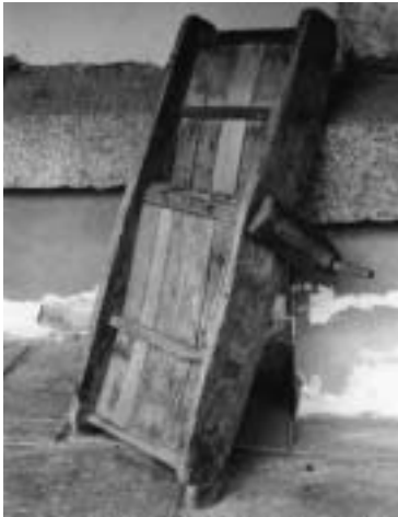
Meierhofer Ratscha.