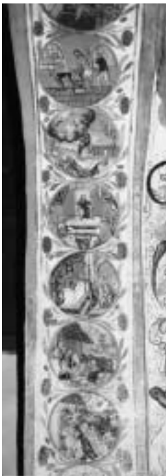
Rosenkranzmedaillons in Platenger Kapelle

Rosenkranz-Monat, Rosachränzmäänat wird der Oktober genannt, da das Rosenkranzfest im Oktober gefeiert wird und es früher Brauch war, hauptsächlich in diesem Monat dem allabendlichen Rosenkranzgebet in der Kirche beizuwohnen.