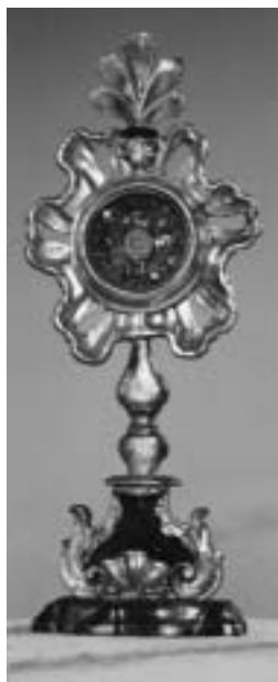
St. Josef.

St. Josef besitzt 1 Standreliquiar, H 50,5 cm, Holz gefasst mit vergoldeten Ranken oben und am Fuss, datiert von Denkmalpflege mit Anfang 18. Jh. Die erste Kapelle datiert von 1461, die heutige wurde 1862 eingeweiht (Weiheerlaubnis