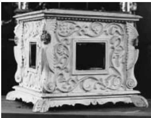
St. Anton, Egga.

von Bischof Nikolaus Franz Florentini an Kanonikus Julius Vinzens). Diese Reliquie im Rankenkranz trägt die Inschrift: “Ex Pallio/S. IOS.: SP: B. V. M.”, d. h. “Ex Pallio Sankti Iosephi Sponsi Beatae Mariae Virginis” und heisst zu deutsch: Vom Mantel des hl. Josef, des Verlobten der seligen Jungfrau Mariae. (Transskription und Übersetzung: Pater Hanspeter Betschart, Stans.)