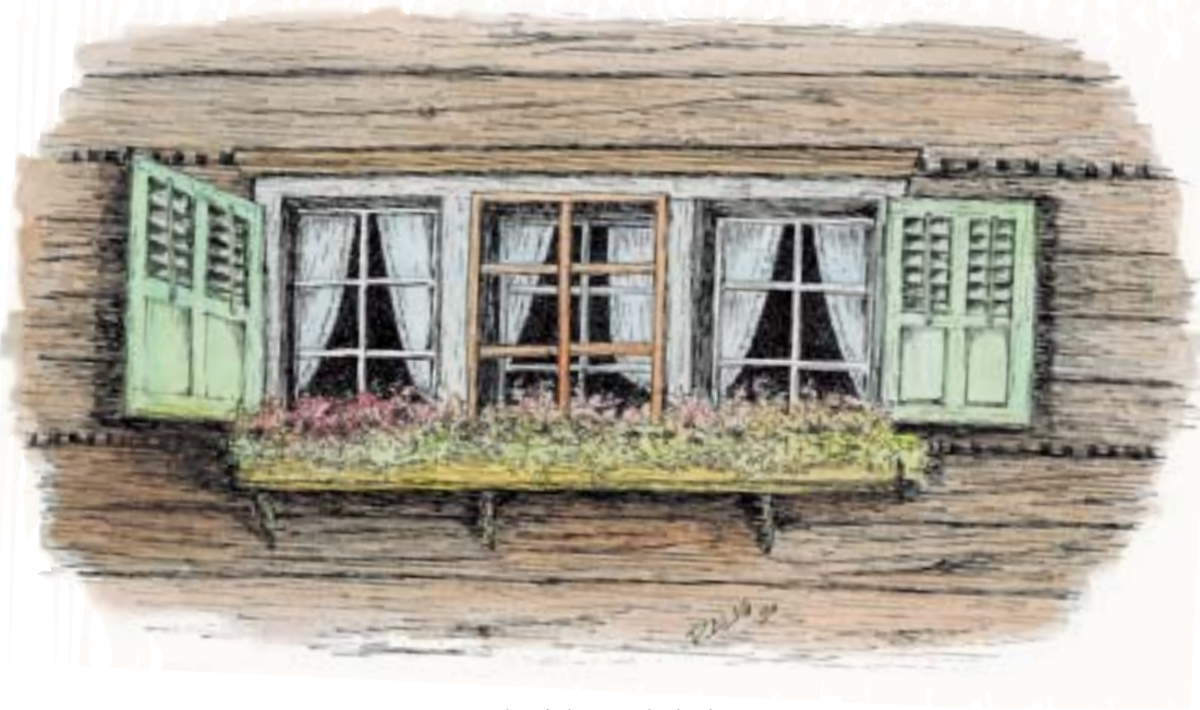
Tuschzeichnung koloriert gezeichnet 1990 von Pius Alig