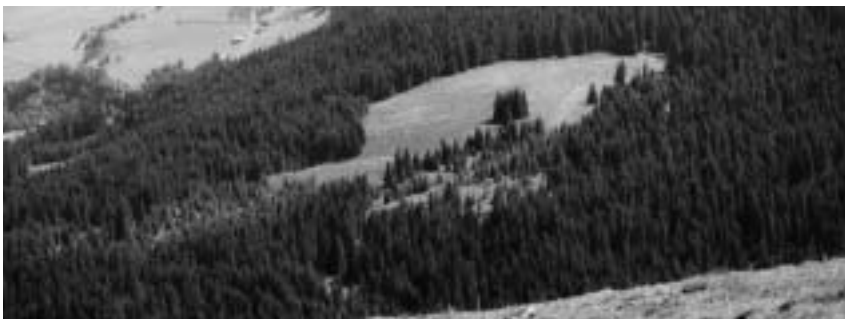
Riederer von Vorderalp aus. Foto 1996 EE.

Alte Wege, die früher direkte Verbindungen zu den Alpen und ins Lugnez bildeten, finden wir noch im Osten der Riadara (direkt nach dem westlichen Ober Huot führend) und im Westen (über Händboda zum Ober Huot). Weitere alte und neue Wege in diesem Gebiet → PSO S. 1052, 1053.