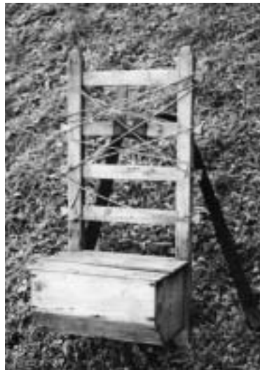
Raff mit Werkzeugkiste.