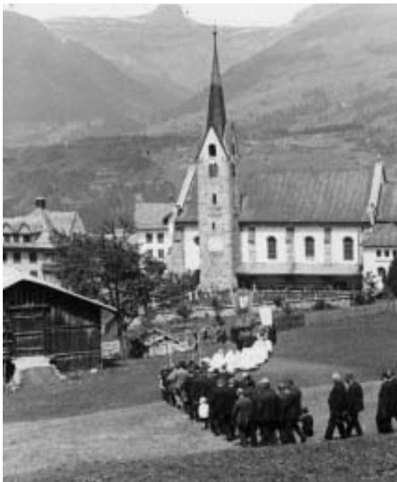
Prozession am Rosenkranzsonntag in den 30er Jahren.

Rosenkranz-Sonntag (eigentlich 7. Okt.) wurde im Laufe der Zeit auf den 1. Sonntag im Oktober verschoben. Er wurde in Erinnerung an den Seesieg der Christen über die Türken bei Lepanto (1571) anno 1572 eingeführt und später als Dank für die von Gott zuteil gewordenen Wohltaten gehalten (Liturgisches Handlexikon). In Meierhof wird dieser Sonntag als Fest mit feierlicher Prozession begangen. → Prozessionen PSO S. 1207. Bis 1992 nahmen die Knabenschaft in Paradeuniform und die Musikgesellschaft jedes zweite Jahr daran teil.